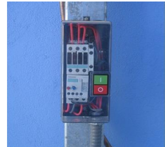
Puesto de Mando