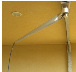
Bandera giratoria 360°