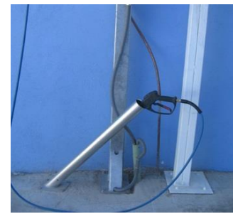
Pistola de Alta Presión