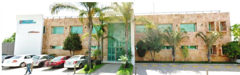
Oficinas corporativas de Inter Ibérica León, Gto.

Somos desde 1989, distribuidores exclusivos para México y Centroamérica del prestigiado fabricante español Istobal, número #1 a nivel global en fabricación de máquinas automáticas para el lavado de vehículos, quien cuenta con más de 65 años de experiencia en el mercado.