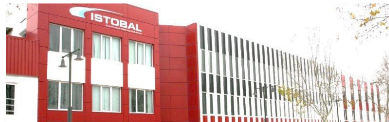
Planta de fabricación y oficinas centrales de Istobal Valencia, España.