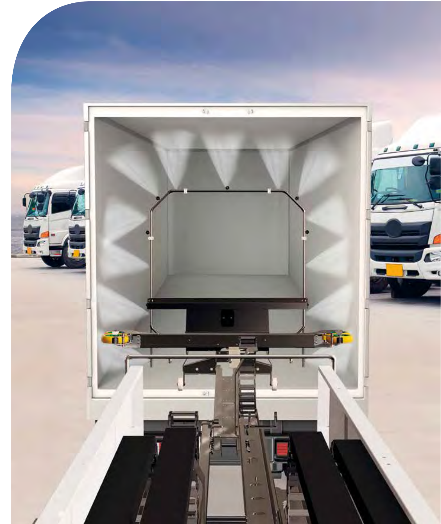
ISTOBAL HW'INTRAWASH Profundidad en el lavado interior